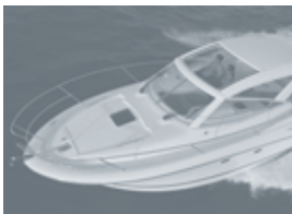
P 30 S

Lancement printemps 2008 Spring 2008 launch