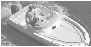
Cap Camarat 5.5 WA