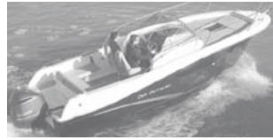
Cap Camarat 7.5 WA