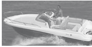
Cap Camarat 6.5 WA